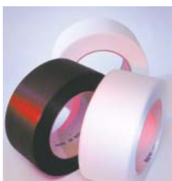
Auf Wunsch: Speziell bedrucktes Band

Packgüter Breite 150–420 mm Länge 150–420 mm Höhe 10–420 mm Gewicht max. 25 kg